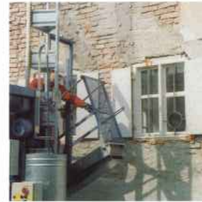
Dzięki mostkowi montażowemu (wyposażenie dodatkowe) pomost transportowy może być zakotwiony bez uprzedniego wznoszenia rusztowania.