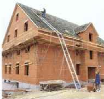
Wciągarki pochyle linowe