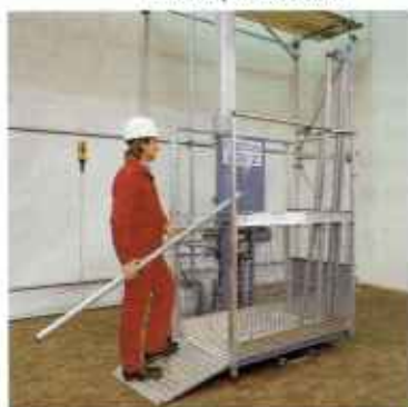
Wciągarki zębatkowe z masztem aluminiowym