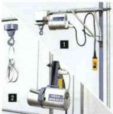
Wciągarki linowe: 1 na ramieniu obrotowym 2 do transportu rusztowań