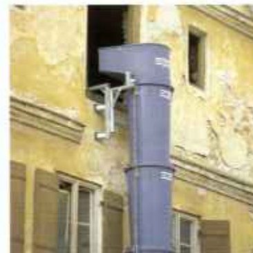
System kubłów zsypowych do gruzu