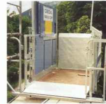
Dla zapewnienia ochrony przed wypadnięciem w miejscach załadunku i rozładunku na piętrze montuje się osprzęt – ocynkowany ognioowo (1 szt. zawarta w dostawie) z mechanicznie ryglowaną фуртą przesuwaną.