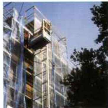
Wciągarki pochyle i pionowe zębatkowe