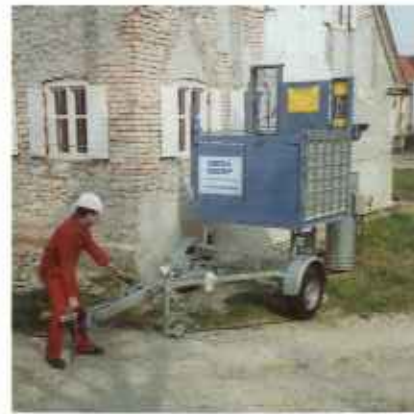
Transport drogowy odbywa się przy pomocy przyczepy. Załadunek i rozładunek następuje za pomocą napędu podestu transportowego.