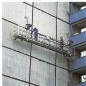
Podwieszane podesty robocze