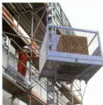
Wciągarki zębatkowe z masztem stalowym