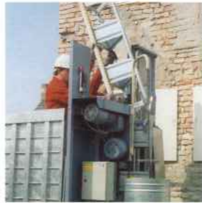
Montaż elementów masztu i kotw masztu następuje z wprost z pomostu. Bez pomocy dźwigu można szybko ustawić poręczne 1,5 m segmenty stalowe masztu z niegubiacymi się śrubami i nakrętkami.